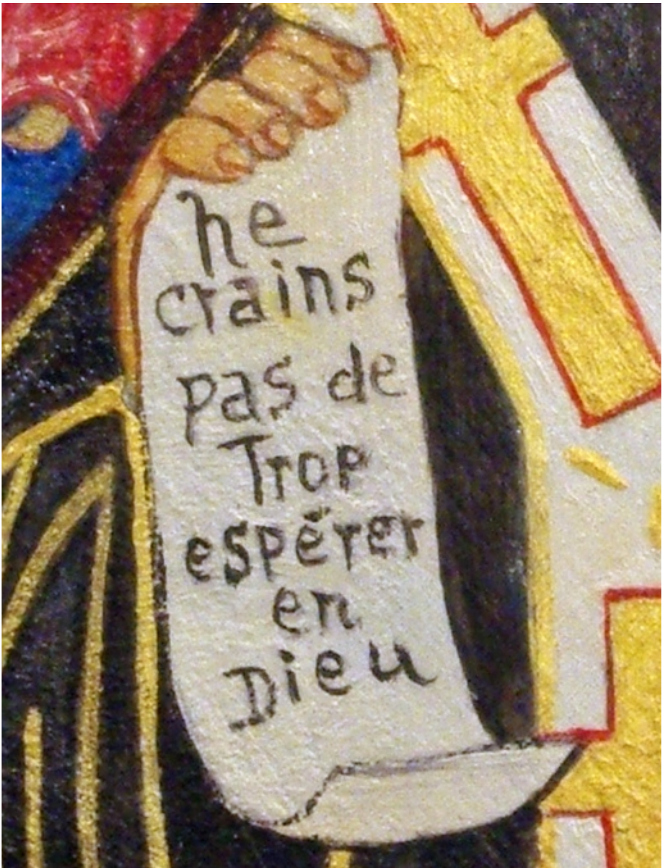
Caratteristica la scritta che l'Allamano tiene in mano e che dimostra la sua sintonia spirituale con lo zio S. Giuseppe Cafasso, santo della fiducia: «Non temere di sperare troppo in Dio».